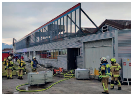
Brand einer Wäscherei Brandursache: Reibungswärme