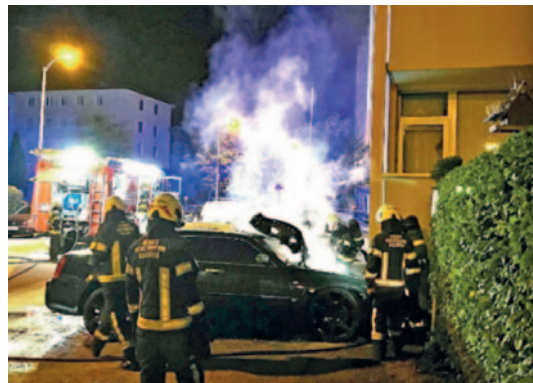
Brand eines KFZ Brandursache: Brandstiftung