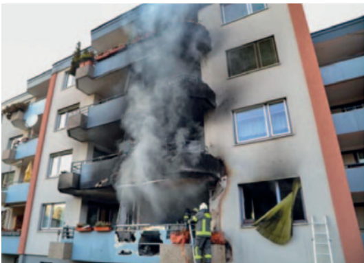
Brand einer Wohnung Brandursache: Brandstiftung