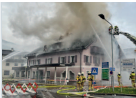
Brand einer Wohnung Brandursache: menschliches Fehlverhalten