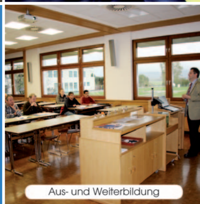
Aus- und Weiterbildung