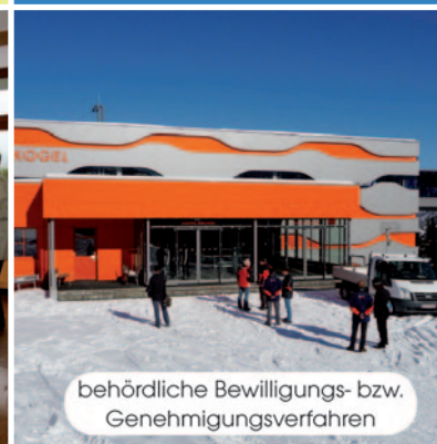
behördliche Bewilligungs- bzw. Genehmigungsverfahren